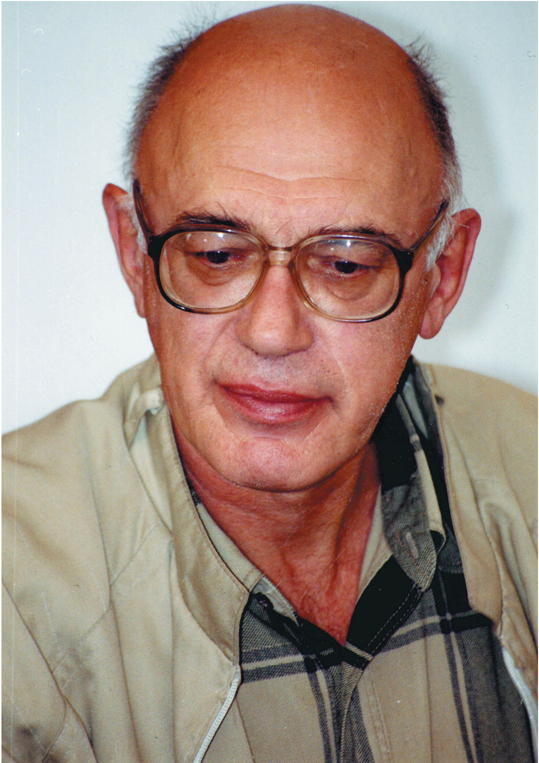
Памяти Дмитрия Яковлевича Резуна посвящается