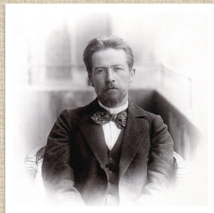
Антон Павлович Чехов